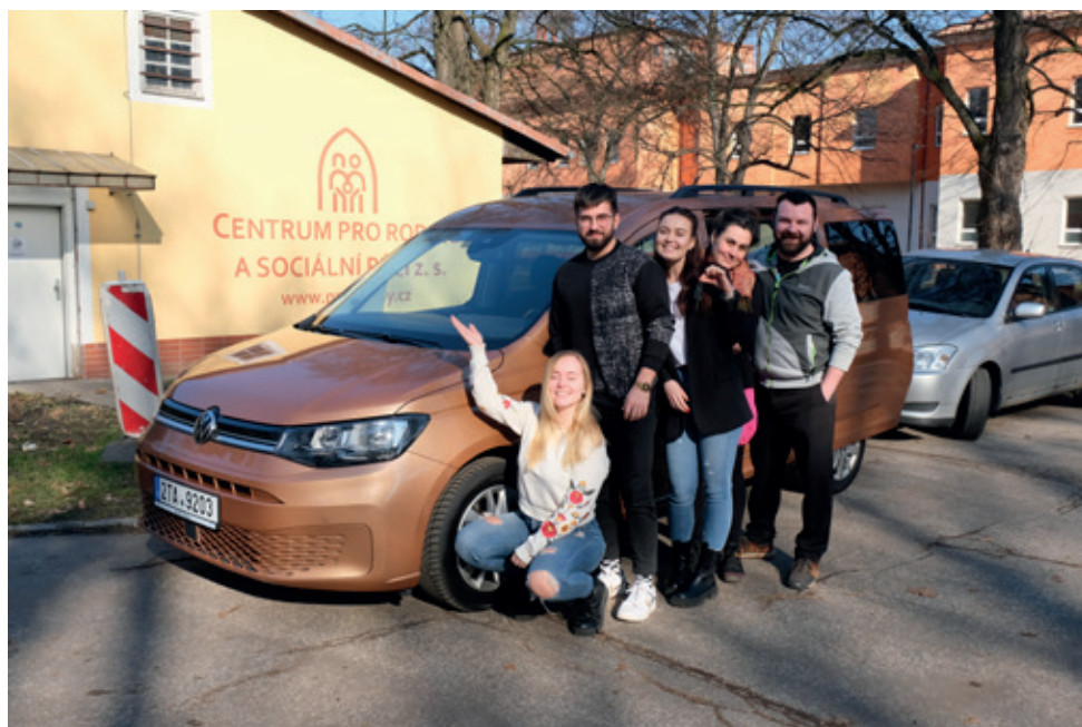
Projekt AUTO pro BRÁNU byl financován Moravskoslezským krajem z Programu KSS a Statutárním městem Ostrava z programu Loterie. Srdečně děkujeme.