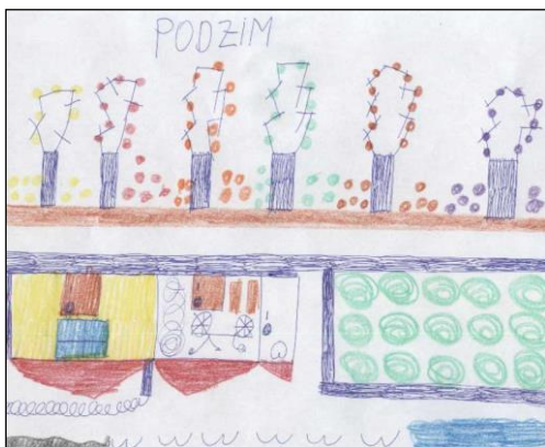
nakreslil Honzík Kliment