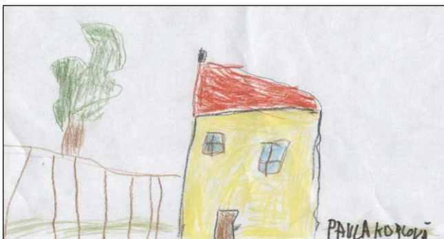
nakreslila Pavlínka Kopolová