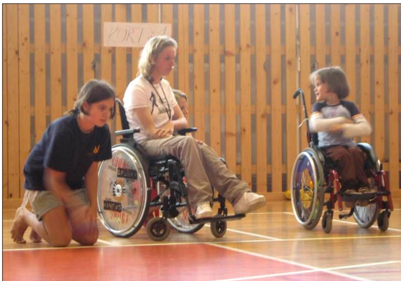
15. Společný turnaj - velice napínavý.