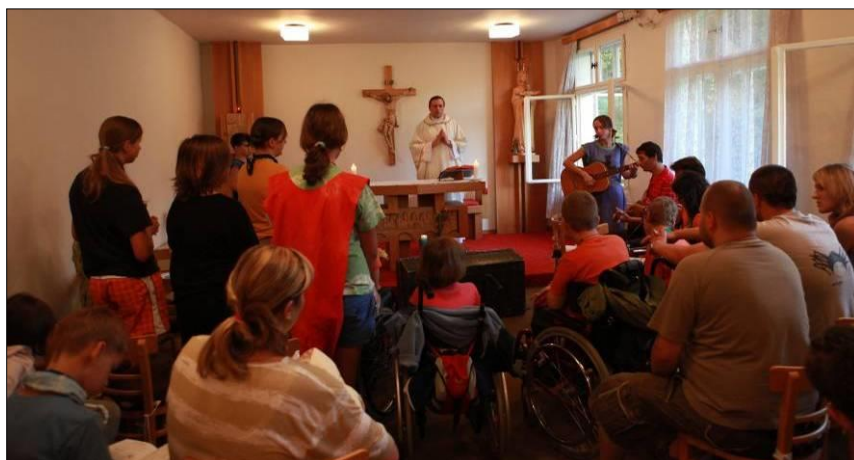
8. Podvečerní mše měla příjemnou atmosféru.