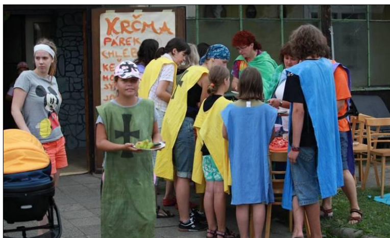
14. Po těžce vydělaných penízkách a smlouvání ve vesnici, městě a podhradí si panoši mohli koupit svou večeři. Někdo si vybral zdravou stravu, ale většina panošů je na maso.