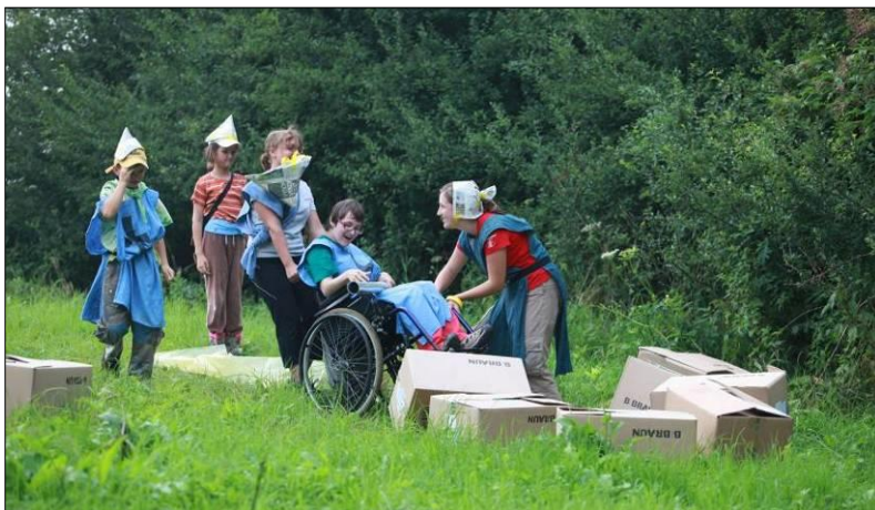
18. Boj byl náročný. Ale všichni ho zvládli a poslední klíč od truhly naši ☺ Teď je čeká cesta do neznáma.