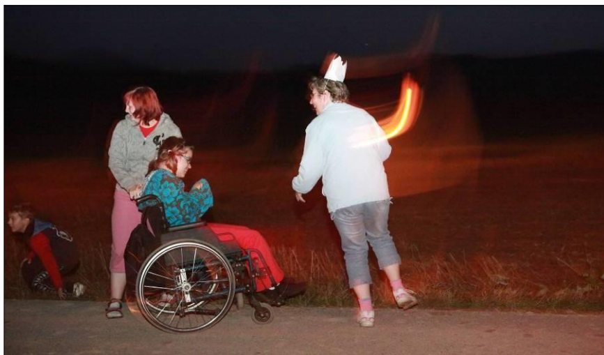
9. Večerní hra, po které byl velký oddech pro všechny. 😊