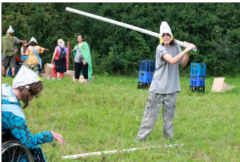
17. Bojovali všichni a statečně. ☺