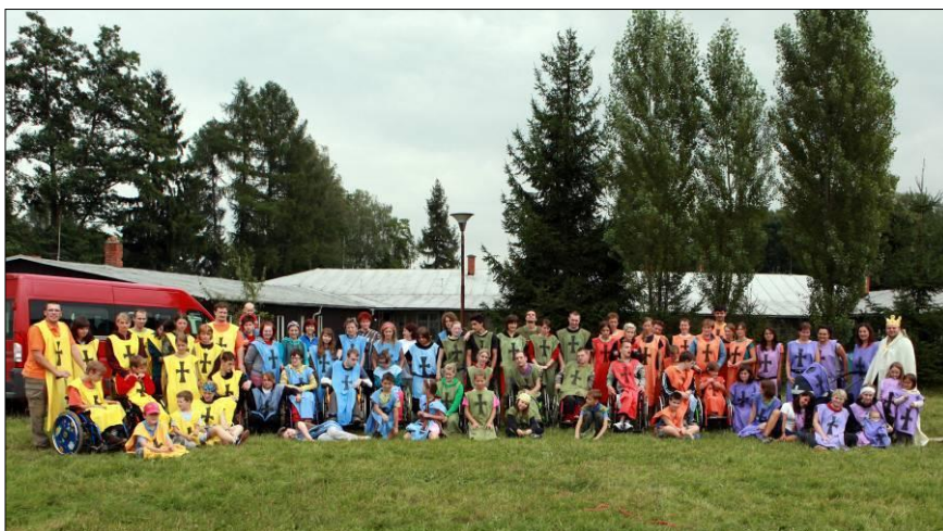
10. Nádherné, barevné společné foto. 😊