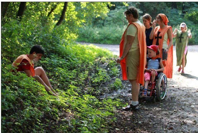
13. Odpolední hra ve vesnici, městě a podhradí. Kde všichni nakupovali uhlí, stříbro, zlato a další potřebné materiály.