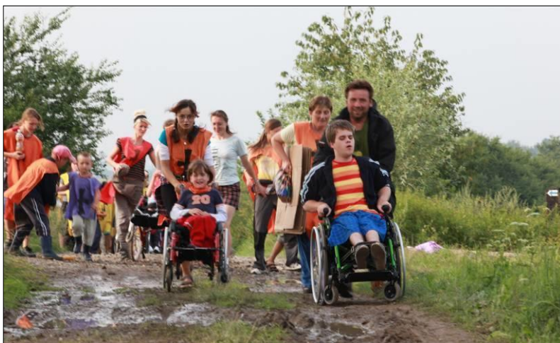
16. Poslední cesta pro záchranu království.