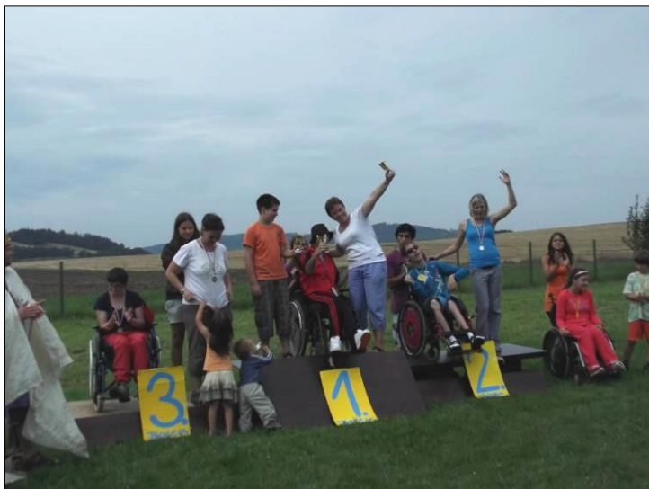
.. a radovali se z vítězství .. ve smíšeném turnaji..