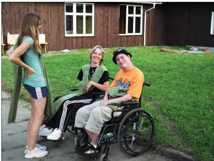
.. navazovali nová kamarádství ..