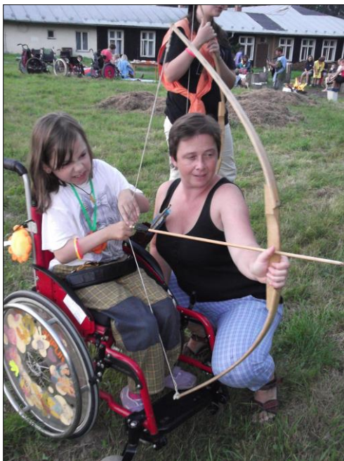
.. a stříleli z luku ..