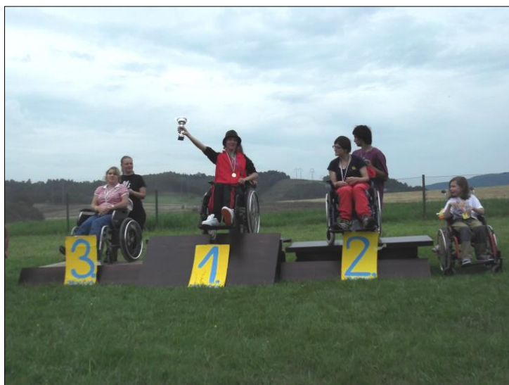
.. i v hlavním turnaji jednotlivců ..