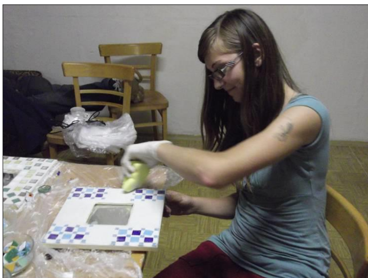
.. tvořili a vyráběli ..