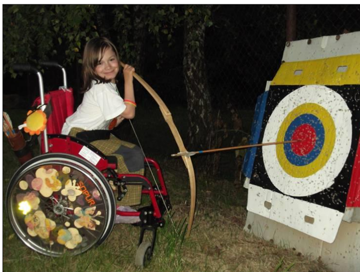
.. a to tak, že dobře ..