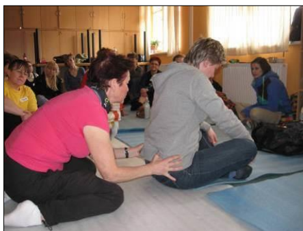
Jak na správný sed