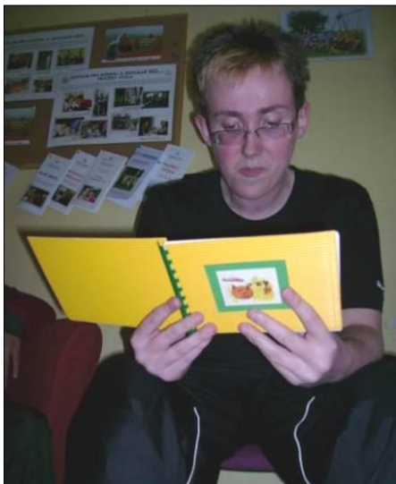
.. a jeho autorské čtení vítězného příběhu..