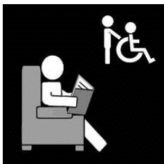
odlehčovací služba RESPIT

Přelom roku se v odlehčovací službě RESPIT nesl ve znamení uzavírání smluv s uživateli na další rok a také konzultacemi se všemi asistenty, které mají sloužit především k jejich podpoře a profesnímu rozvoji. Asistenti si stanovili