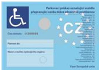
EVROPSKÝ PARKOVACÍ PRŮKAZ OZNAČENÍ O7