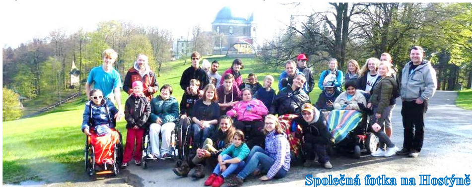
Společná fotka na Hostýně

6 až 8. 5. 2017 se konal společný víkendový pobyt uživatelů BRÁNY a lidí z Buntaranty. Po srazu jsme se rozdělili do skupinek, někteří jeli auty a někteří odvážlivci vlaky. Pro mnohé to byla první a zajímavá zkušenost. Po příjezdu jsme se ubytovali na krásné bezbariérové chatě Březiny nedaleko Valašského Meziříčí, kde