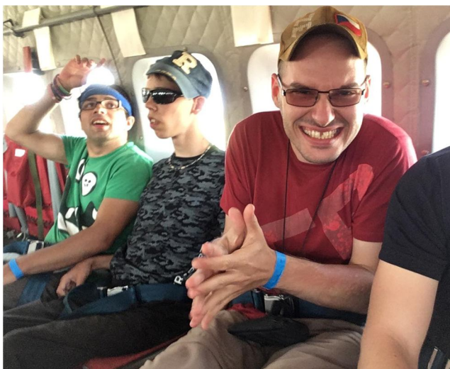
napsal Michal Kvača

Po celý den tam hrála živá hudba a probíhal dobrovolný program. Motorkářská show, kynologové s pejsky, střelba na plechovky, prohlídky letadel, prohlídka vojenských zbraní. Vyšlo nám krásné počasí a celý den svítilo sluníčko. Takže výlet byl super.