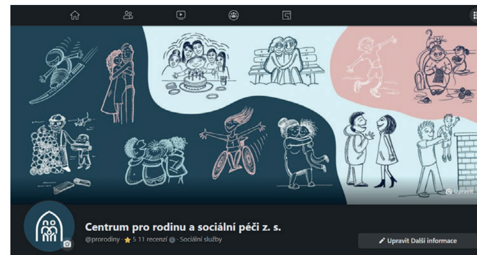
Vizuál se propal do facebookové stránky.

Tak. A přesně podle něj poznáte, že se jedná právě o nás. A to na letáčcích, pozvánkách, Facebooku, webu. Prostě kdekoliv. Ať je vždy hned patrné, že se jedná právě o naše CPR. Prezentovat se chceme také novými barvami a autorskými ilustracemi. A hlavně bychom byli moc rádi, aby pro vás informace byly srozumitelné a jednoduše dostupné. Tak snad se nám to podaří!