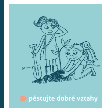
Pokud potkáte tyto barvy a náš ikonický tvar, budete vědět, že jsme to my!