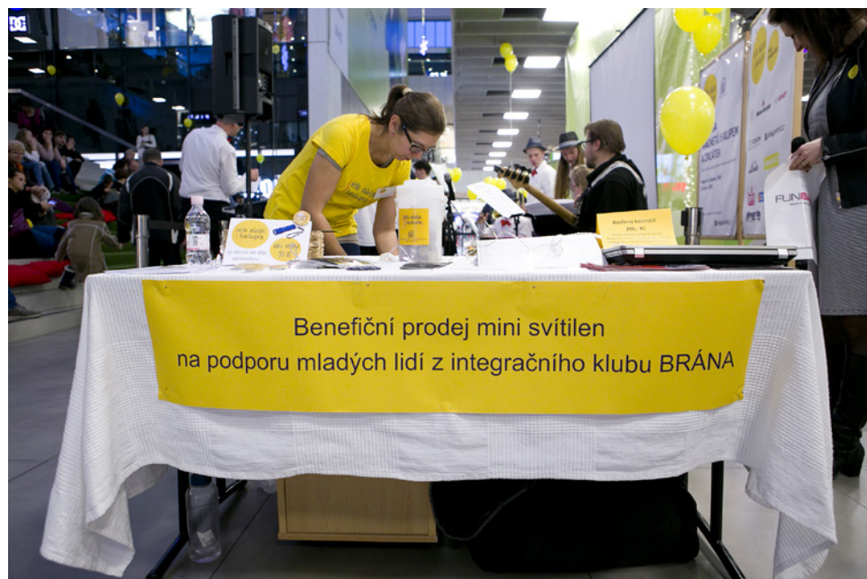
fotografie z roku 2019

Již 14. ročník této benefiční akce připravujeme na sobotu, 20. listopadu ve Forum Nová Karolina (11–18 hod.) Opět si budete moci koupit minisvítilnu od uživatelů sociálně aktivizační služby BRÁNA a podpořit tak jejich cesty za poznáním a umožnit jim „žít svůj život“. Věříme, že akce proběhne s hudebním i tanečním doprovodným programem, tak, jak jsme zvyklí.