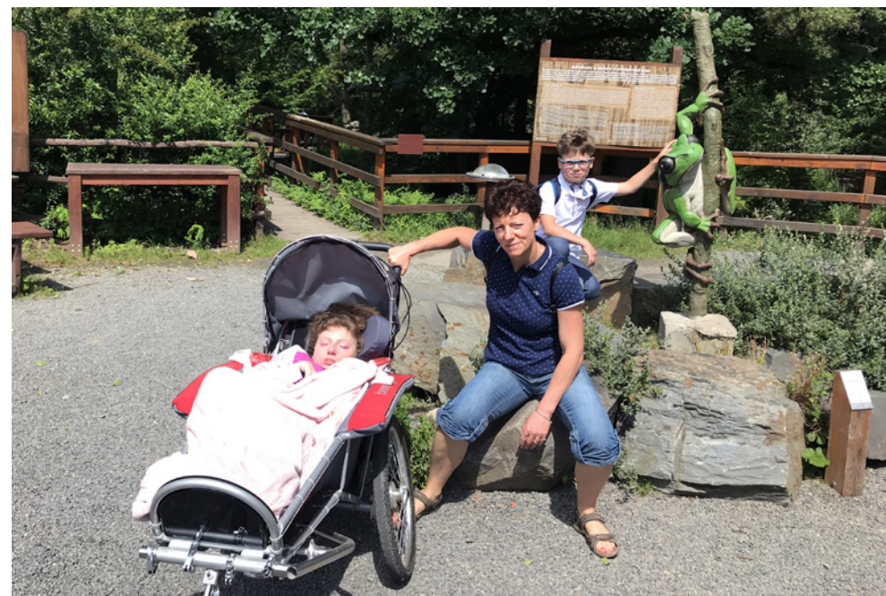
Opravu potřebuje celkem 8 vozíků v naší půjčovně a náklady jsou 40 000 Kč.