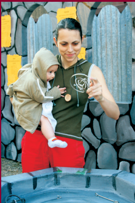
Klub ÁMOS - Dobrodružství na hradě