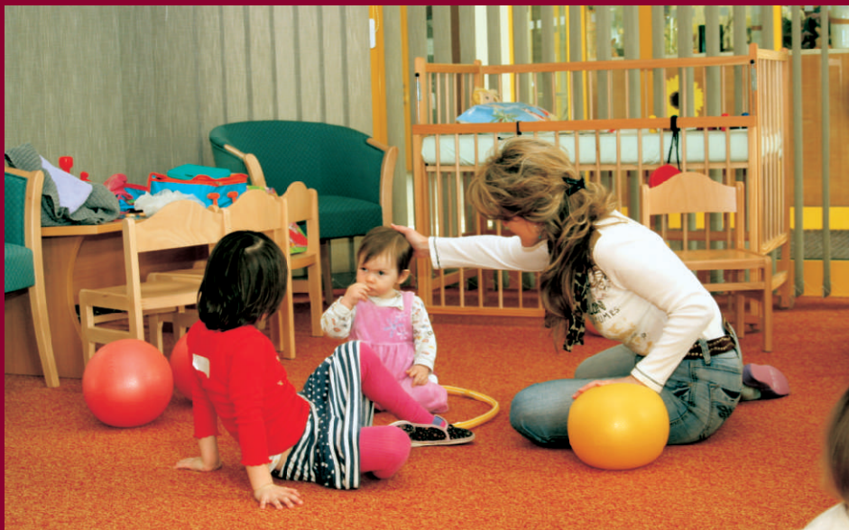
Kurz aktivního rodičovství