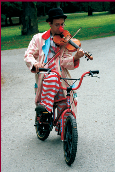
Klub ÁMOS - Velehrad