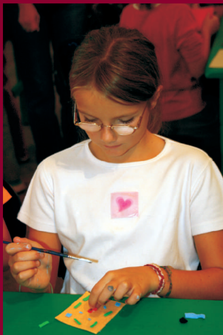
Klub ÁMOS - Textilní řemesla