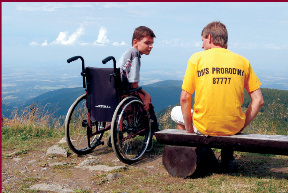
Výzva - DMS kampaň

VYSLÝŠTE NAŠÍ "VÝZVU" A POMOŽTE DĚTEM S TĚŽKÝM POSTIŽENÍM V JEJICH KAŽDODENNÍM ŽIVOTĚ!