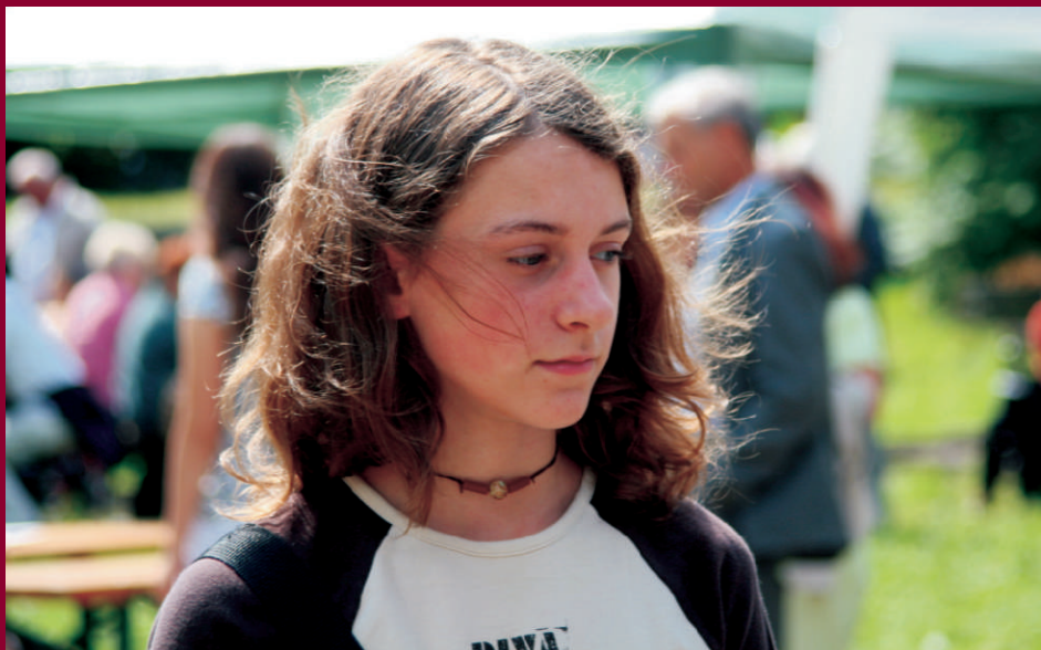
Klub ÁMOS - na Velehradě