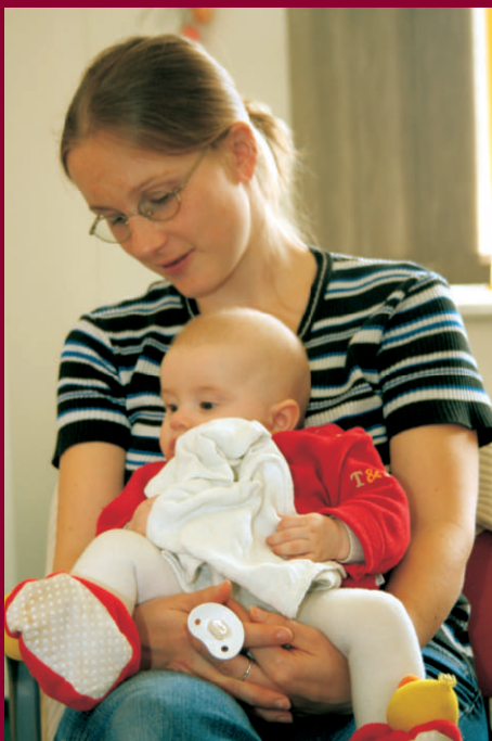
Kurz aktivního rodičovství