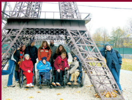
Výzva - Brána