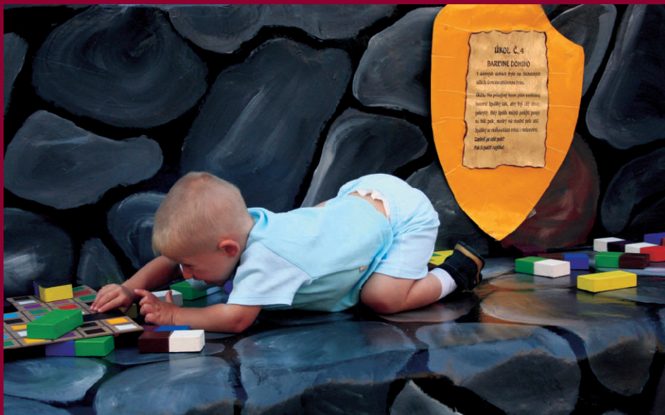
Klub ÁMOS - Dobrodružství na hradě