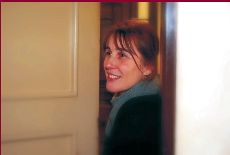
Nashledanou v CPR .....