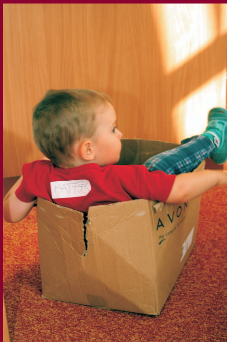
Kurz aktivního rodičovství