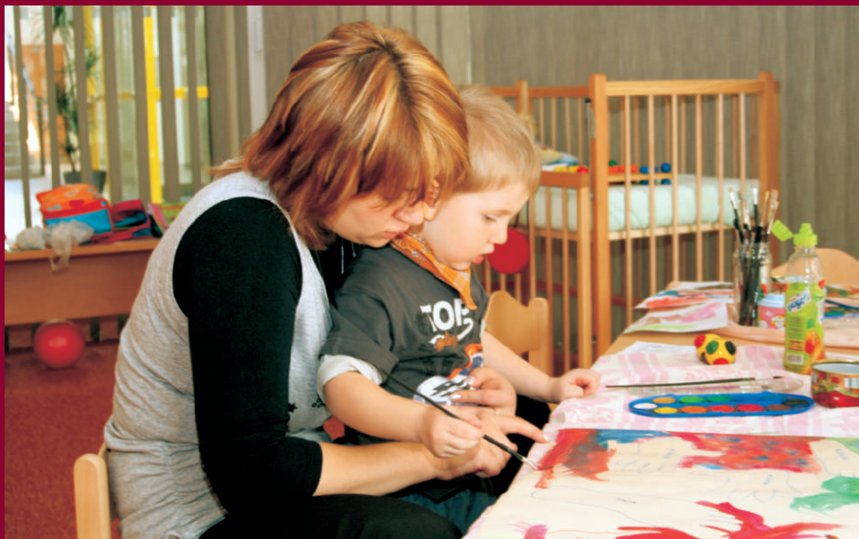
Hlídnání dětí - Přednášková činnost