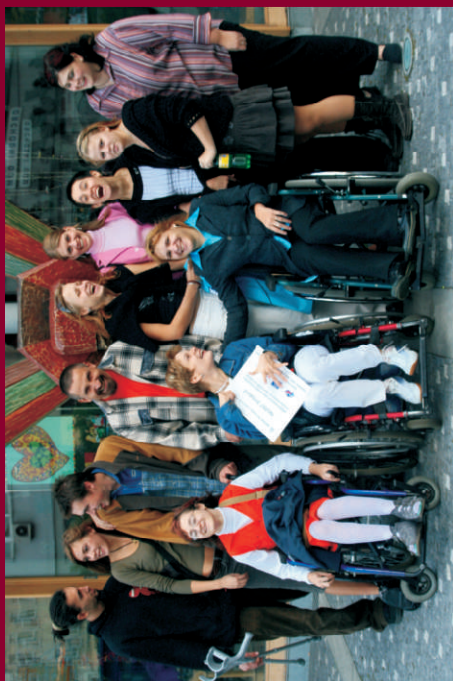
Na muzikále Jakob...