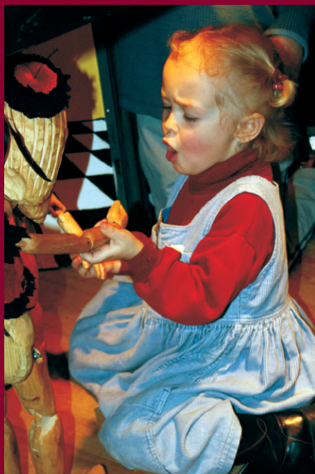
Na muzikále Jakob...