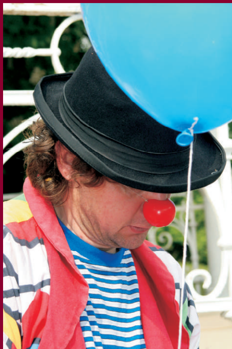
Klub ÁMOS - Muzeum na kolečkách