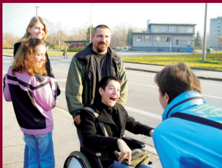
Výzva - Integrace